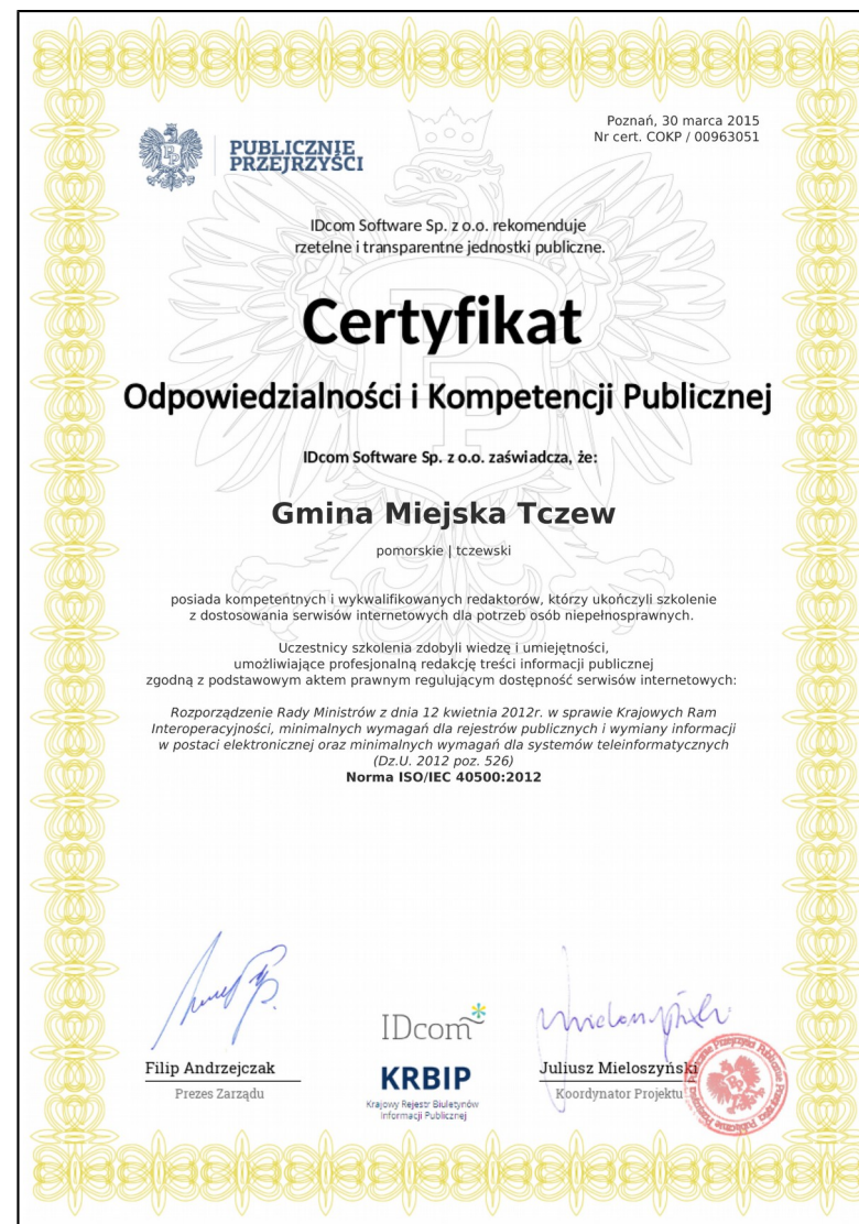
Przykładowy Certyfikat Kompetencji i Odpowiedzialności Publicznej nadany Gminie Miejskiej Tczew

Certyfikat poświadcza uzyskanie wiedzy i umiejętności niezbędnych do prawidłowego udostępniania informacji publicznej zgodnie ze standardami WCAG 2.0.